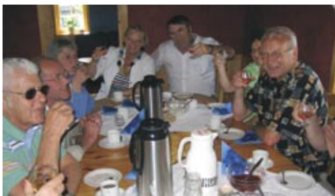
Lystig lag på Gjetbergsvollen.