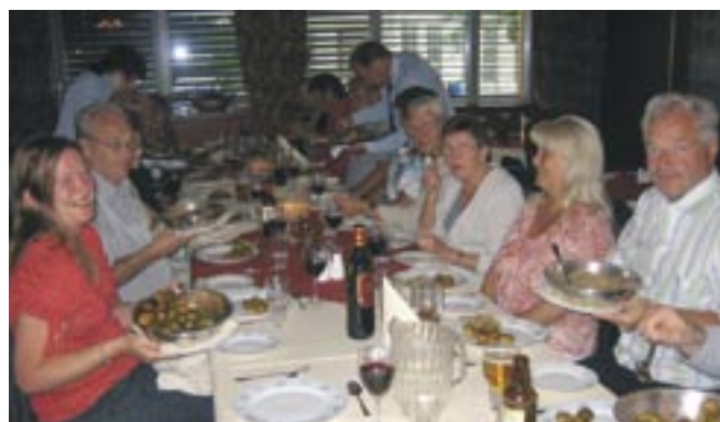
Middag på Røros.