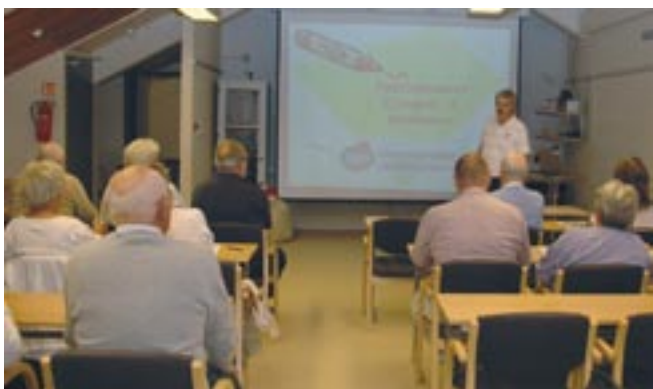
Deltagerne følger med og kommer med innspill.

Tradisjonen tro greide A.L.F Buskerud også i år å holde seminar for sine medlemmer. Dette er et veldig populært tiltak som vi håper å kunne fortsette med, også i de kommende år. I år var det 33 personer og en hund som dro til fjells, for å gjøre oss fete! Oset Høyfjellshotell er kjent for et godt kjøkken, vi er godt vant her og de skuffet ikke denne gang heller.