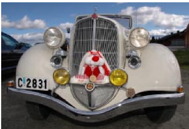
Vår maskot ALF-Willy koser seg i fronten på en Terraplane 1935-modell.

Tradisjonen tro greide A.L.F Buskerud også i år å holde seminar for sine medlemmer. Dette er et veldig populært tiltak som vi håper å kunne fortsette med, også i de kommende år. I år var det 33 personer og en hund som dro til fjells, for å gjøre oss fete! Oset Høyfjellshotell er kjent for et godt kjøkken, vi er godt vant her og de skuffet ikke denne gang heller.